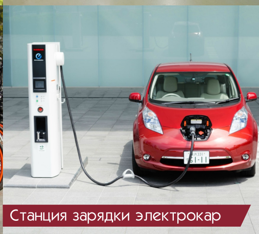
Станция зарядки электрокар