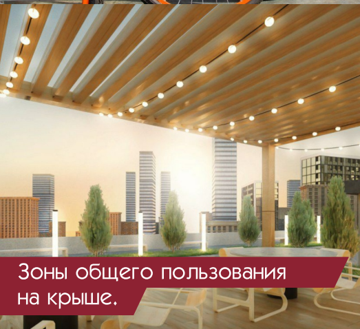
Зоны общего пользования на крыше.