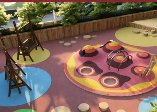
Безопасная прогулочная зона для детей.