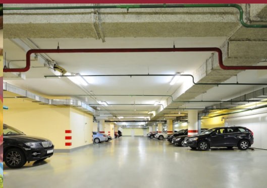
Подземная личная парковка