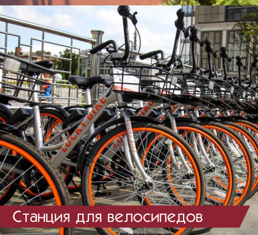
Станция для велосипедов